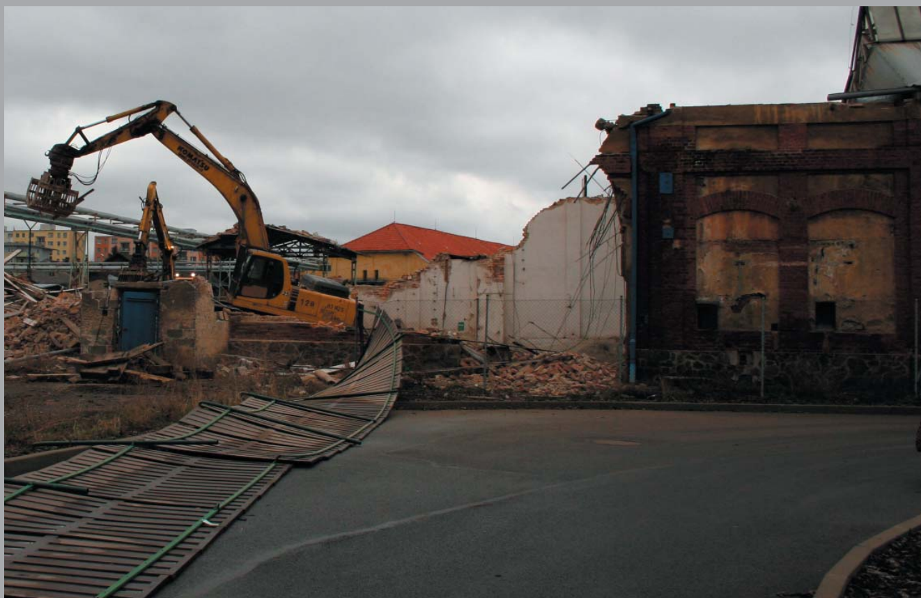
Stav továrny v pátek 19. 1. 2007 Přes mnohé protesty občanů i odborníků firma InterCora provádí překotnou demolici.