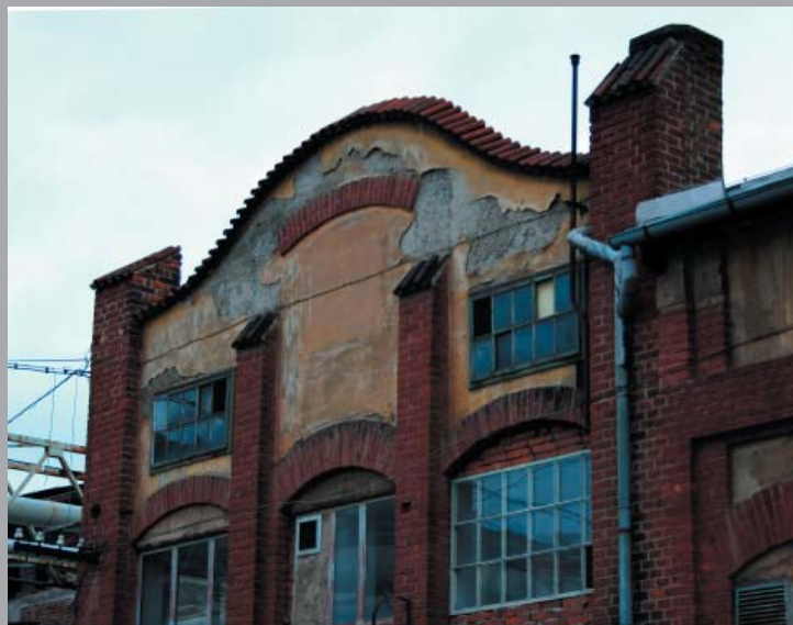
Čtvrtek 18. 1. 2007 Secesní část Schifauerovy továrny - slévárna barvných kovů.